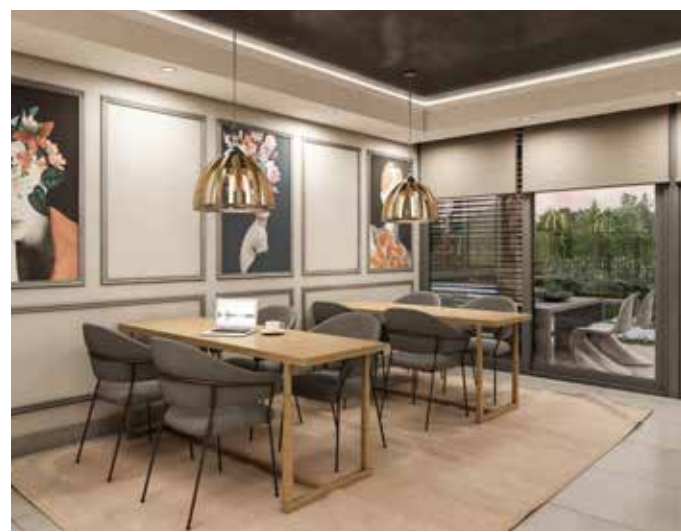
terrace work café