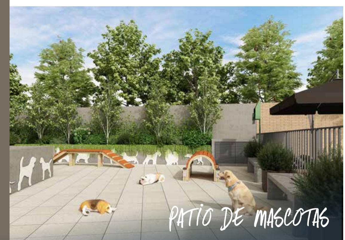
PATIO DE MASCOTAS